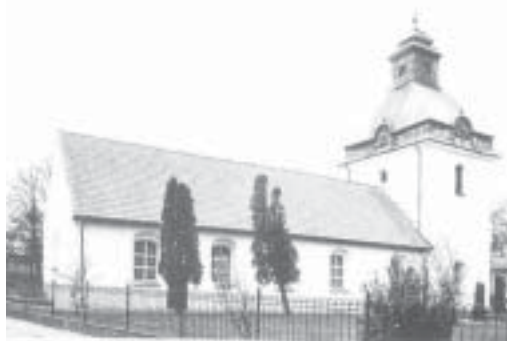
Falkenbergs Gamla Kyrka

hade gått igenom småskolseminariet med goda betyg. Jag hade då allaredan börjat i folkskolan vid Skrea kyrka och fick därför icke tillfälle att deltaga i hennes, utan tvivel, goda undervisning. Båtsman Riis hade förut tjänstgjort i Kungl. Örlogsflottan, och han kunde berättas om många märkliga ting som han hade sett och om mycket av äventyr som han hade upplevat till sjöss. Han hade även varit med och gjort en långresa med Korvetten Freja över Atlanten till, bland andra platser, Rio de Janeiro i Brasilien.