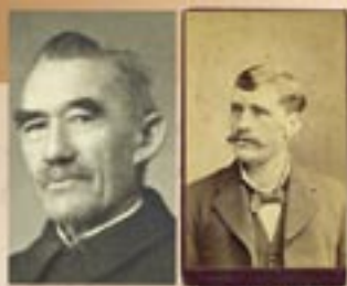
Två broder skäls åt i ungdomen. Nu möts de i källorna som bara blir fler. Och även deras ättlingar.