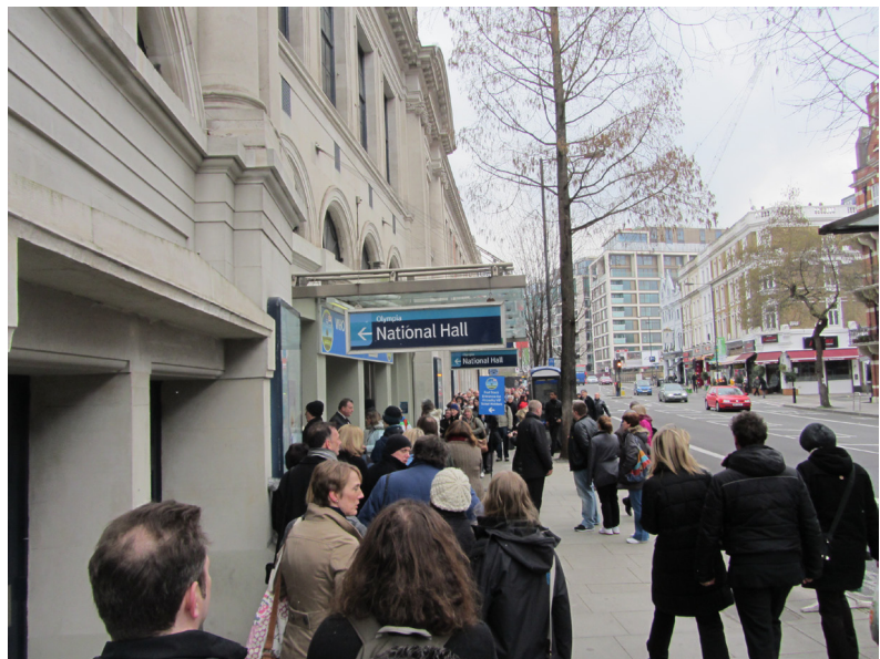
Den korta kön för att hämta internet-beställda biljetter