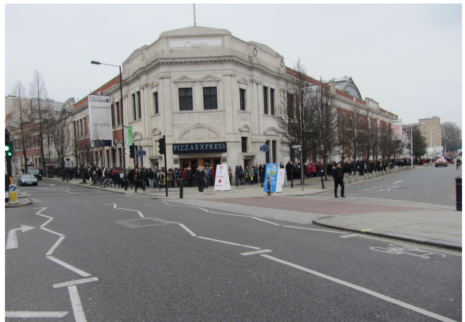
Den långa kön för att köpa biljetter.