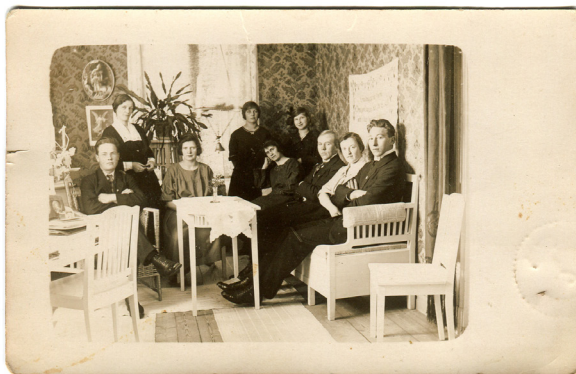
Forskat och skrivet av Eva Johansson, Västervik

Med bilder och mellanrubriker i din släktberättelse gör du den mer läsvänlig och intressant. Detta är en sida ur min släktberättelse om min fars släkt, som på farfars sida kommer från Vänersborgstrakten. Texten har jag skrivit i ett Word-dokument som jag både skrivit ut och gjort pdf-filer av och skickat till släktingar.